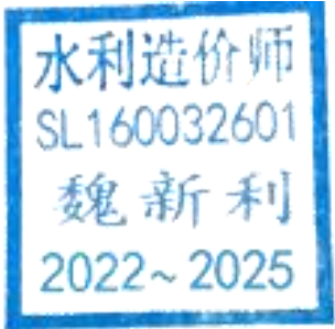
建筑工程单价汇总表